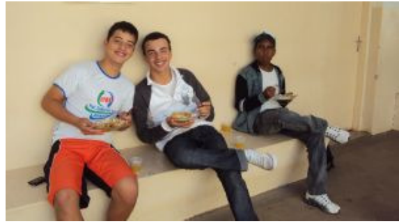
Almoço na ETEC (parceria com a Prefeitura Municipal de Adamantina)