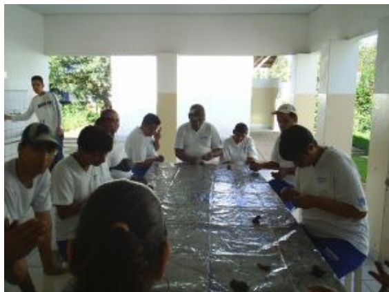
AULAS DE MODELAGEM EM ARGILA

Esse projeto de ação social, desenvolvido por alunos voluntários das 2as séries do Ensino Médio ocorrerá às terças e quintas-feiras, no período da tarde. Esse projeto existe nesta ETEC há anos e é muito positivo e valorizado, tanto pela Clínica de Repouso e APAE, que todo ano solicita a sua continuidade porque ressaltam a sua validade terapêutica e afetiva. Também é muito valorizado pela escola porque percebemos o envolvimento e as mudanças positivas no comportamento dos alunos que atuam voluntariamente, já que desenvolvem o senso de solidariedade e amor ao próximo e, principalmente o respeito às diferenças. Os alunos sentem-se úteis e importantes, criam vínculos afetivos com essas pessoas e se fortalecem como indivíduos porque fazem a diferença. No ano passado a CAPS (Centro de Atendimento Psico-Social, de Adamantina) solicitou que prestássemos esse serviço às pessoas atendidas por eles - conseguimos então, oferecer aulas de informática.