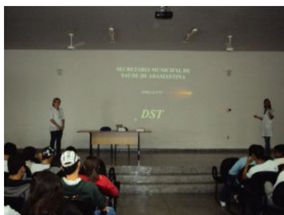
PALESTRA "D.S.T." (Todos os alunos do Ensino Técnico- Auditório da ETEC/2010 - Adamantina)

As habilitações existentes na U.E., (com exceção do curso de Enfermagem) não têm estágio obrigatório, entretanto a equipe escolar empenha-se em indicar e buscar constantemente colocação destes alunos no mercado - seja como empregado ou mesmo como estagiário, o que tem sido um pouco mais difícil após a aprovação da nova lei federal de estágios, desde agosto de 2008.