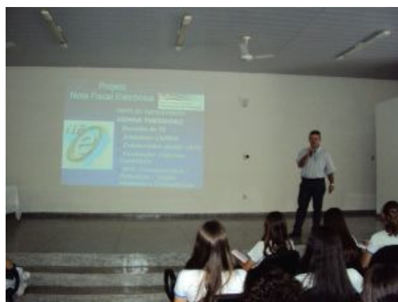
PALESTRA "NOTA FISCAL ELETRÔNICA" (Contabilidade e Administração - Auditório da ETEC/2010 - Adamantina)