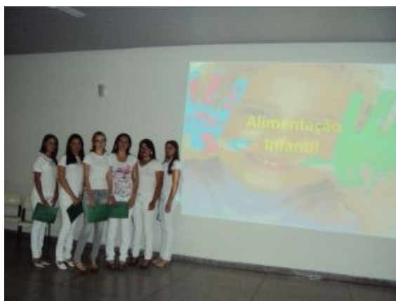
Apresentação do 4º ET - Enfermagem (nov/2010)

de informática disponível para a formatação dos trabalhos e acesso a internet. A validação do TCC ficará a critério do professor responsável pela disciplina que acompanhou diretamente os alunos mas haverá apresentação dos resultados para um grupo de pessoas da escola, formado essencialmente pelo Professor que ministrou a disciplina; o Coordenador de Área da habilitação em questão; o Coordenador Pedagógico, outros professores da habilitação convidados e direção. Estes trabalhos serão sempre apresentados na última semana do mês de junho ou na última semana do mês de novembro, nas datas marcadas pelas coordenações juntamente com os professores. A direção da U.E. dará todo o suporte técnico administrativo para garantir a realização do TCC durante o semestre, inclusive no que diz respeito à gravação em mídia; impressão e encadernação espiralada simples dos trabalhos e, garantirá horário livre de uso dos Laboratórios de Informática para a realização das aulas com acompanhamento do orientador. Todos esses parâmetros fazem parte do Regulamento Geral do TCC desta ETEC, aprovado pelo Conselho de Escola. Abaixo, apresentação de alguns trabalhos realizados em 2010.