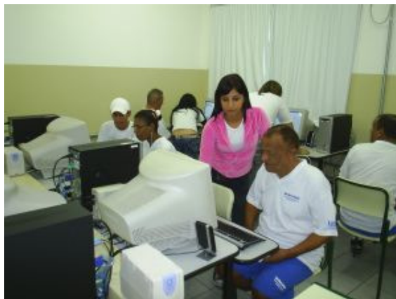
AULAS DE INFORMÁTICA

formadas e as instituições de assistência da cidade serão visitadas por eles com a finalidade de conhecerem o modo de vida dessas pessoas e aproximarem-se um pouco mais de suas necessidades.