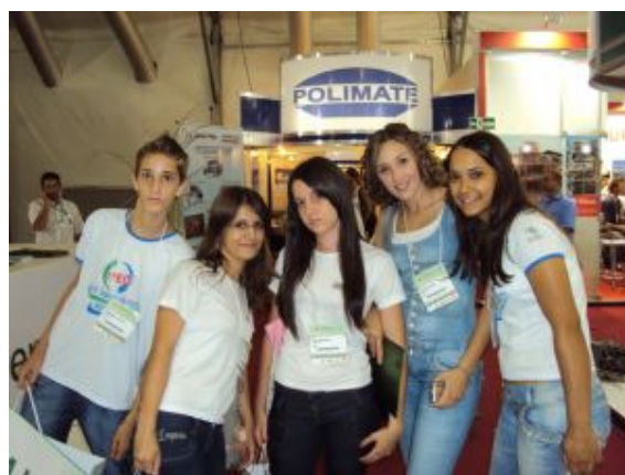
VISITA TÉCNICA À FEICANA – ARAÇATUBA (março/2010)

Mesmo em outras áreas, em que o estágio não é obrigatório, a ETEC procura sempre promover palestras com profissionais das áreas diversas e visitas técnicas nas diferentes empresas, ligadas aos cursos, para que os alunos possam aproximar-se da realidade do mercado.