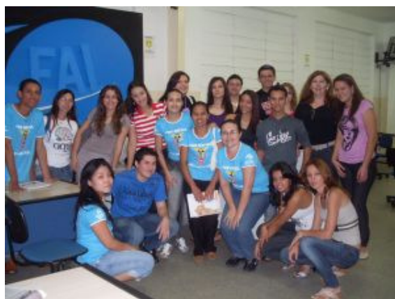
VISITA À RÁDIO CULTURA-FAI (3º ET -Contabilidade/2010/Adamantina)