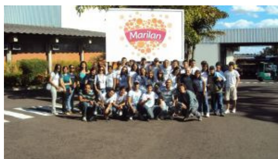
VISITA À MARILAN - (3º ET - Informática - 2010/Marília)

Mesmo em outras áreas, em que o estágio não é obrigatório, a ETEC procura sempre promover palestras com profissionais das áreas diversas e visitas técnicas nas diferentes empresas, ligadas aos cursos, para que os alunos possam aproximar-se da realidade do mercado.