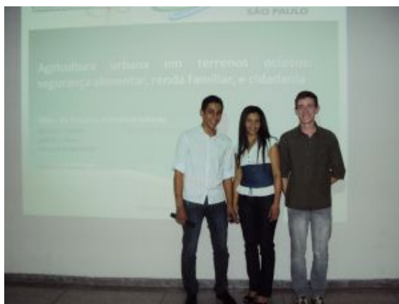
Apresentação do 3º ET - Administração (nov/2010)

Com relação à avaliação dos alunos nas diferentes habilitações do Ensino Técnico e Médio ela dar-se-á de acordo com os princípios descritos no Regimento Comum das ETECs, competências, habilidades e atitudes e a eles serão dadas oportunidades diversas de serem avaliados, conforme registro nos Planos de Trabalho Docente, arquivados na U.E. e acompanhamento dos Coordenadores de área e pedagógico.